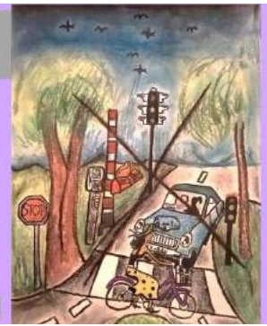
Rác Réka 12 éves

A „KISMŰVÉSZ 2021” pályázat díjazottjai: