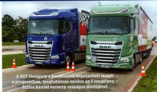
A NIT Hungary a kezdetektől képviselteti magát a programban, meghatározó módon az 5 tengelyen – biztos kézzel verseny országos döntőjével