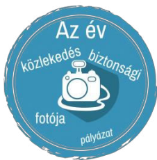
Az év közlekedésbiztonsági fotója

A pályázat értékelése után a nyertesek a díjakat a bírálóbizottság képviselőitől egyénileg egyeztetett módon és időpontban kapják meg, illetve vehetik át. Az eredmények online kerülnek kihirdetésre a Közlekedési Kultúra Napjához kapcsolódóan, 2026. május 11-én, a Nap honlapján és Facebook oldalán.