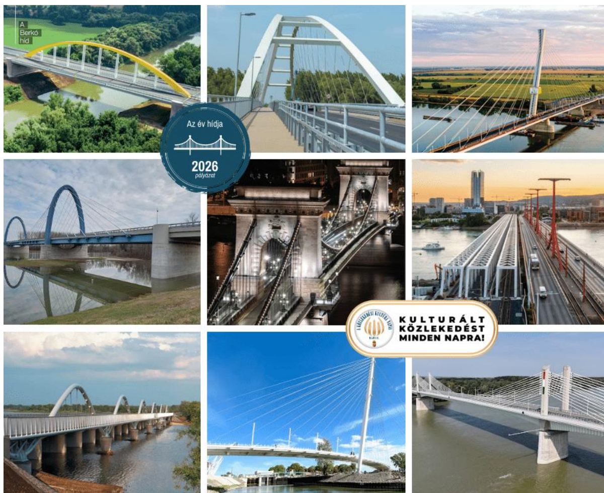
Berkó híd (M44 Körös-híd)

Az eredményhirdetés május 11-én lesz A Közlekedési Kultúra Napjának nyitórendezvényén.